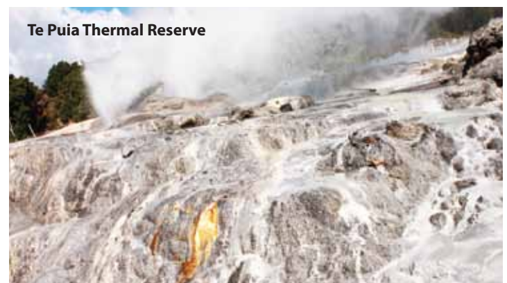
Te Puia Thermal Reserve

早餐后, 专车送往奥克兰国际机场办理登机手续, 带着纽西兰假期旅游的美好回忆及纪念品返回家园。