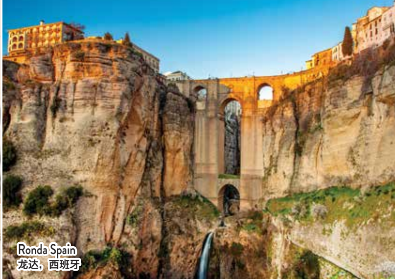
Ronda Spain 龙达, 西班牙