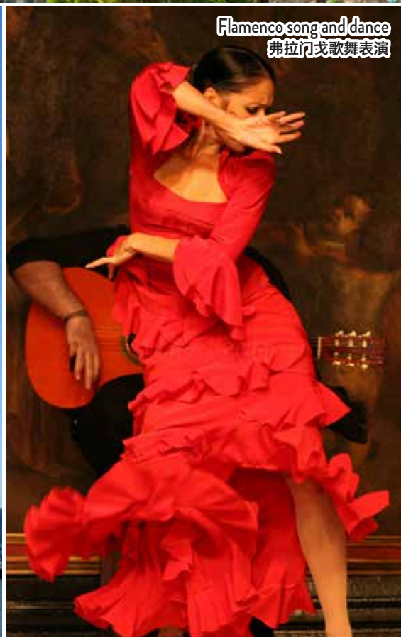
Flamenco song and dance 弗拉门戈歌舞表演