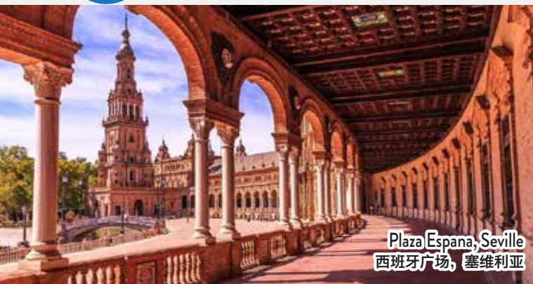
Plaza Espana, Seville 西班牙广场, 塞维利亚