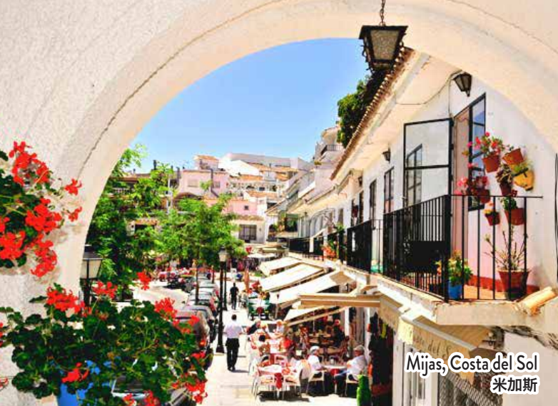
Mijas, Costa del Sol 米加斯