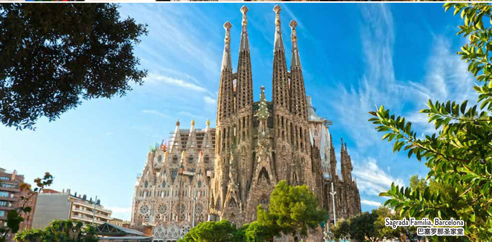
Sagrada Família, Barcelona 巴塞罗那圣家堂