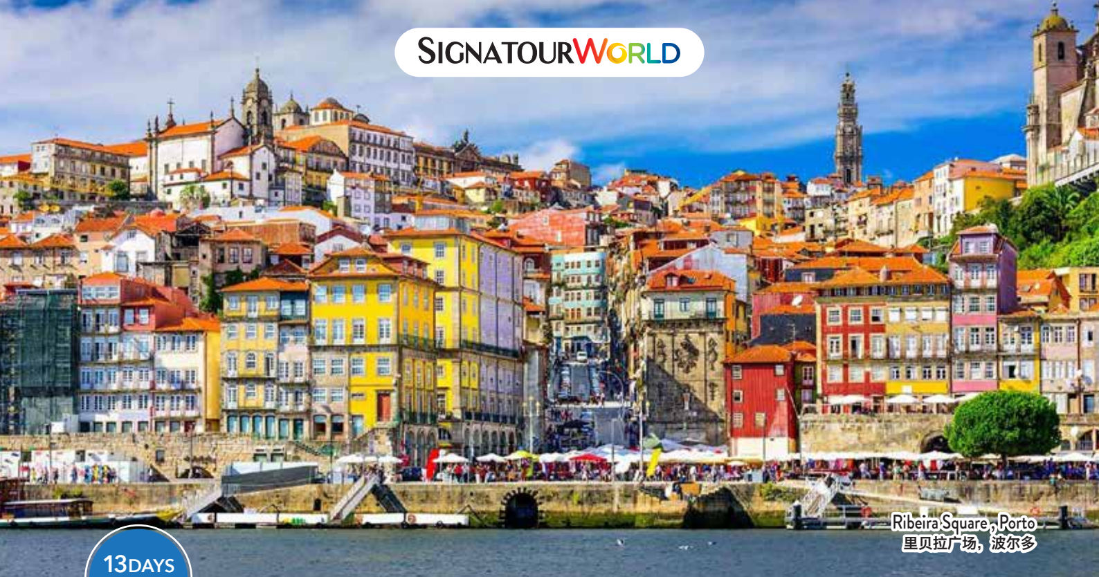
Ribeira Square, Porto 里贝拉广场, 波尔多