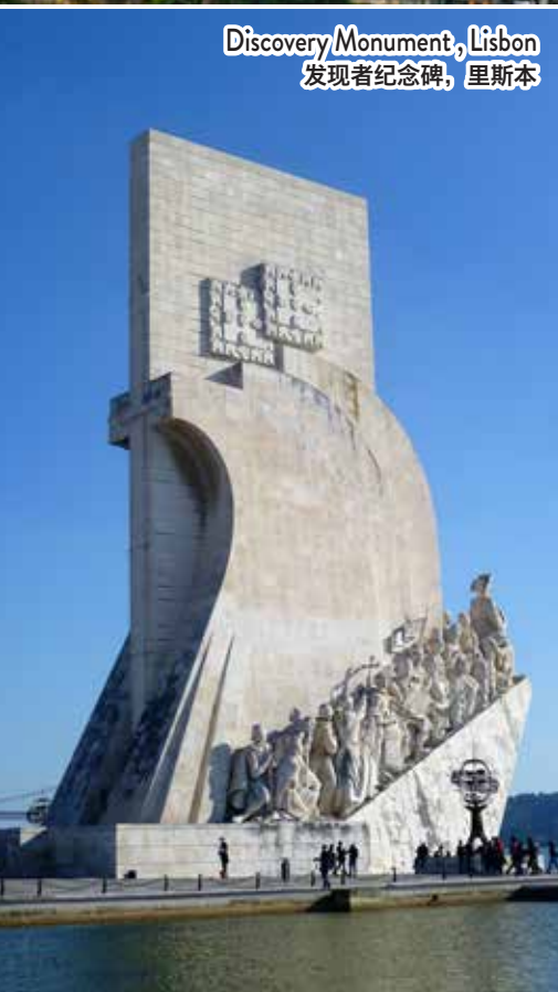
Discovery Monument, Lisbon 发现者纪念碑, 里斯本